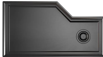
Spülbecken Diade Gun Metal 3028 856